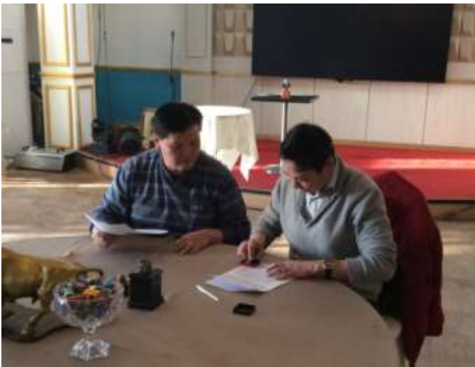
Бонд эзэмшигчдэд гардуулж буй батламж