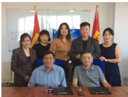
Хувьцаат орон сууц төслийн үйл ажиллагаанд идэвхитэй оролцож байгаа хамт олон бол манай барилга угсралтын компаниуд байлаа.