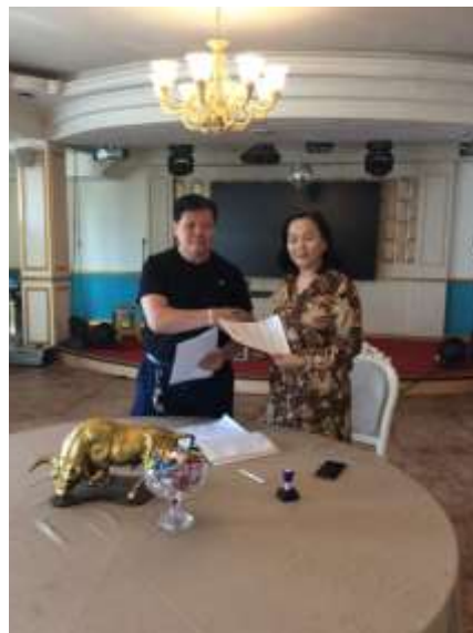
Анхны бонд эзэмшигчид

Хаалттай бондыг зах зээл дээр борлуулах ажлыг мэргэжлийн байгууллага болох "МОНСЕК үнэт цаасны компани" ХХК эрхлэн явуулж байна.