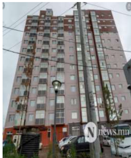
Манай 32 хувьцаа эзэмшигчийн амьдарч буй ХОС ЦАЙЗ хотхоны барилгын зураг