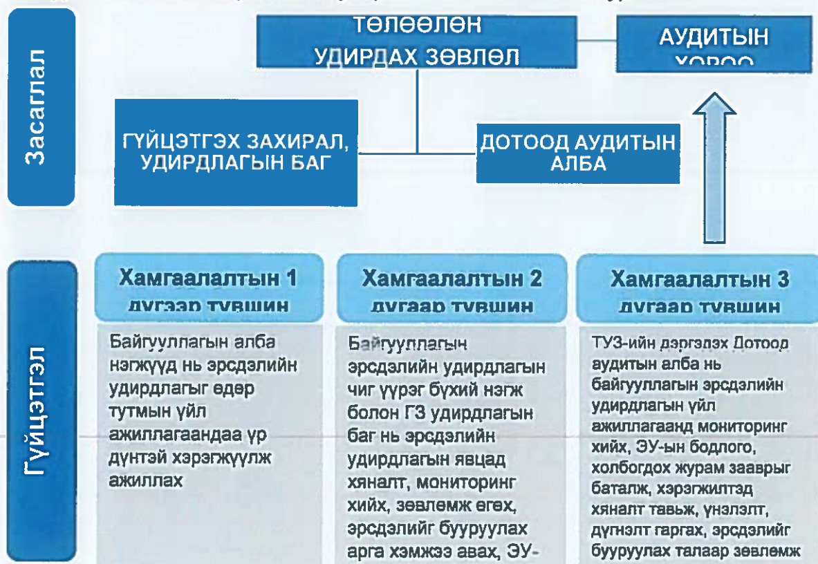
Зураг 1. МХБ-ийн эрсдэлийн удирдлагын засаглалын зураглал

2.2.3. Хамгаалалтын 3 дугаар түвшин: МХБ-ийн Төлөөлөн удирдах зөвлөлийн дэргэдэх Дотоод аудитын алба нь эрсдэлийн хамгаалалтын 1 болон 2 дугаар түвшний эрсдэлийг удирдах үйл ажиллагаанд мониторинг хийх болон эрсдэлийн удирдлагын бодлого, холбогдох журам, зааврын хэрэгжилтэд хяналт тавьж, үнэлэлт дүгнэлт гаргаж, эрсдэлийг бууруулах талаар зөвлөмж өгөх ба Төлөөлөн удирдах зөвлөлийн дэргэдэх Аудитын хороонд тайлагнаж ажиллана.